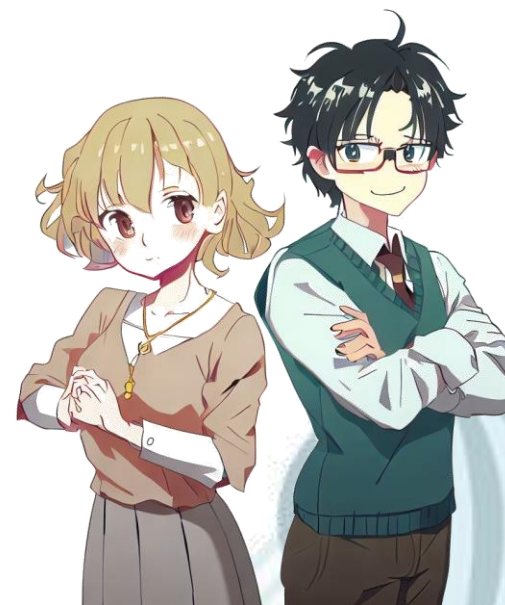
學校教師及自主學習推動者