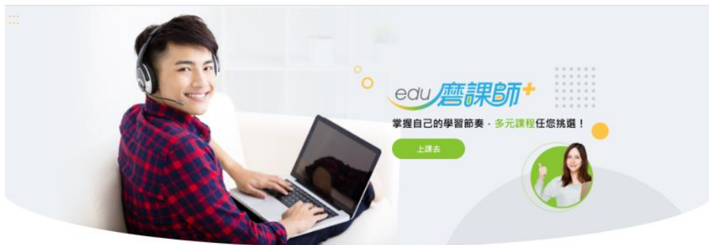
教育部磨課師 數位學習課程