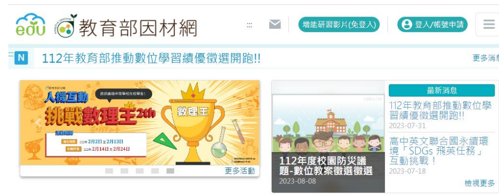
教育部因材網 數位教學課程